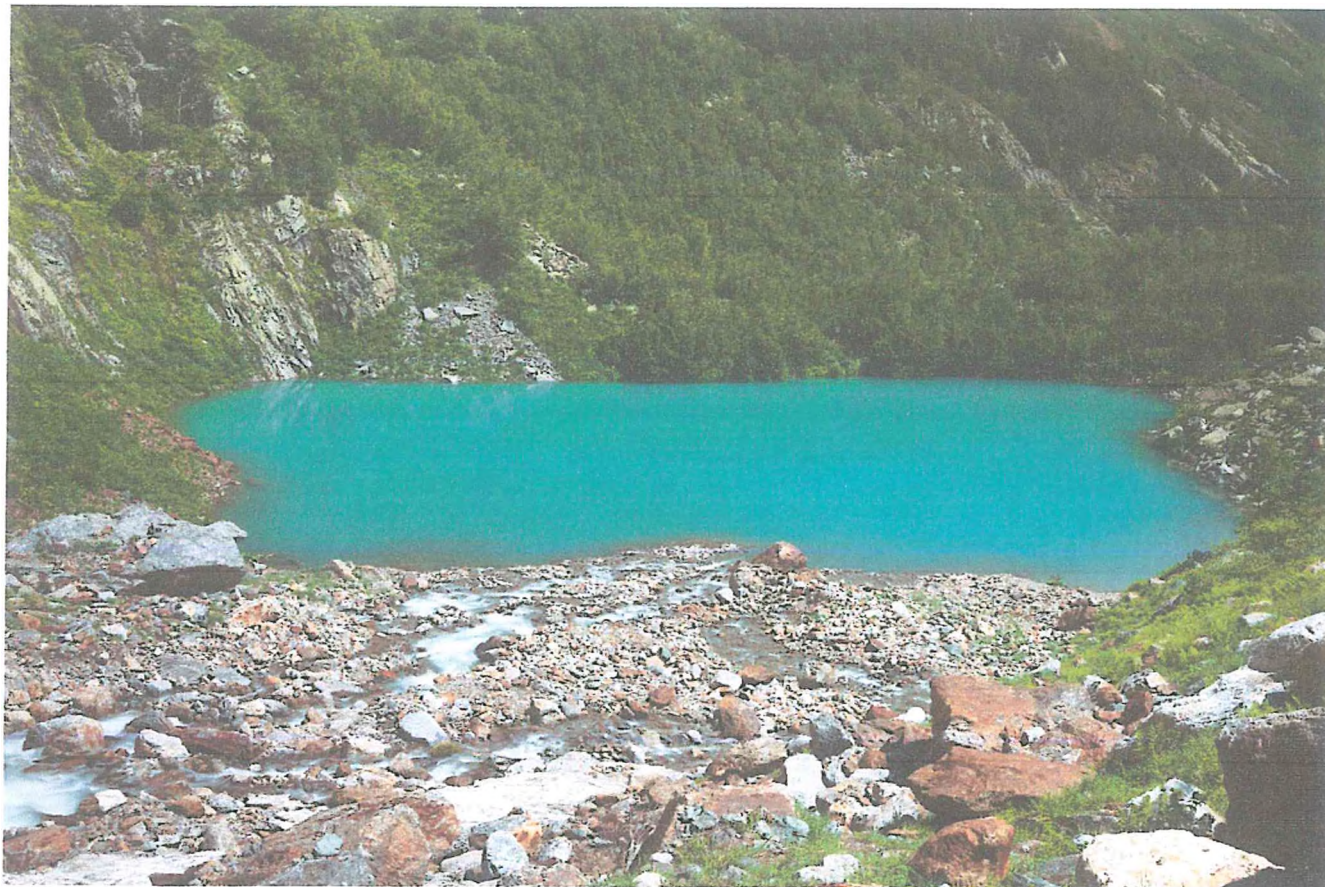
5 фото: Турье Озеро