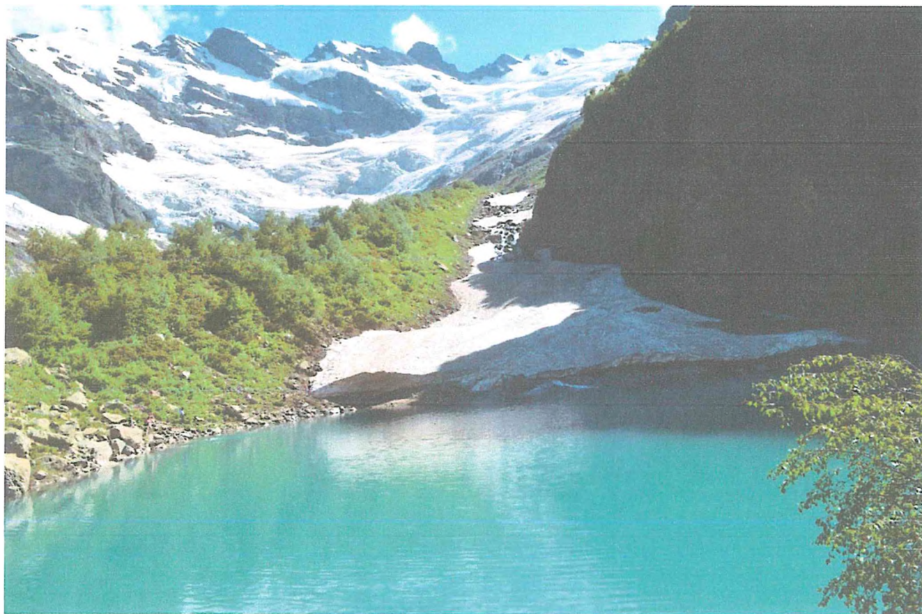
4 фото: Турье Озеро