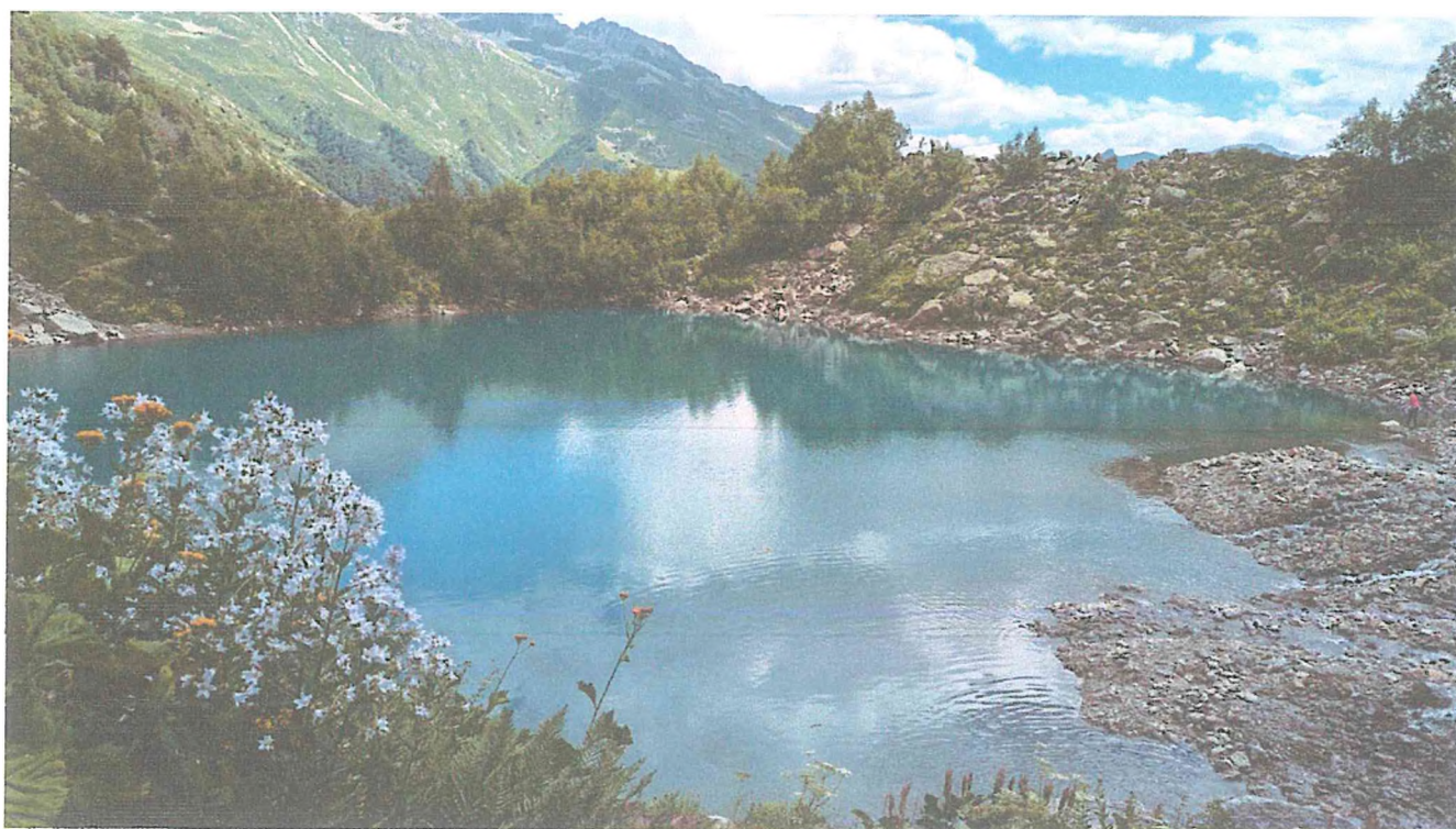
6 фото: Турье Озеро