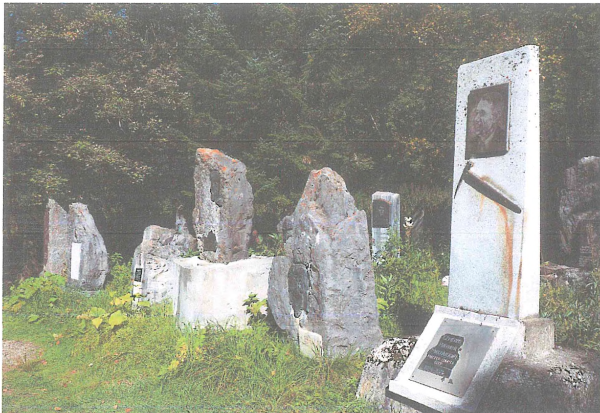
1 фото: Кладбище Альпинистов.