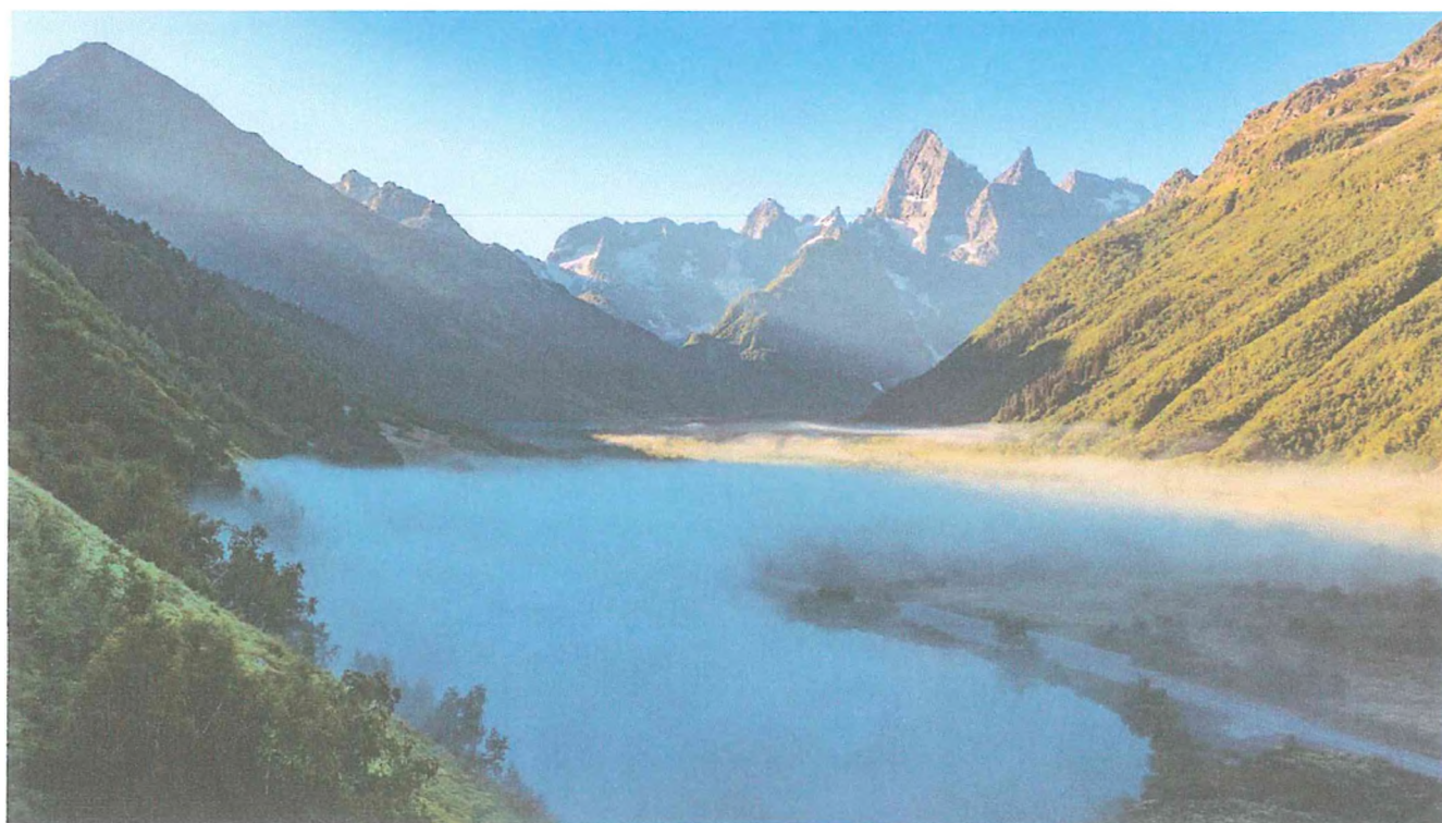
2 фото: Озеро Туманлы-Кель.