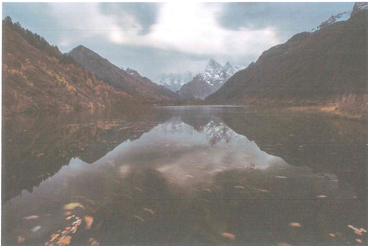
1 фото: Озеро Туманлы-Кель.