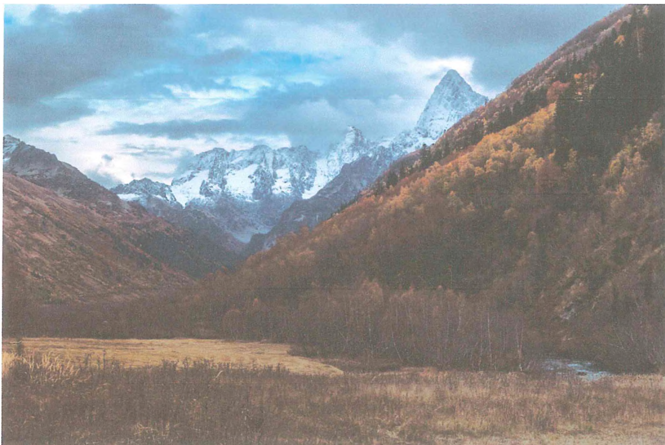
5 фото: Ущелье Гоначхир.