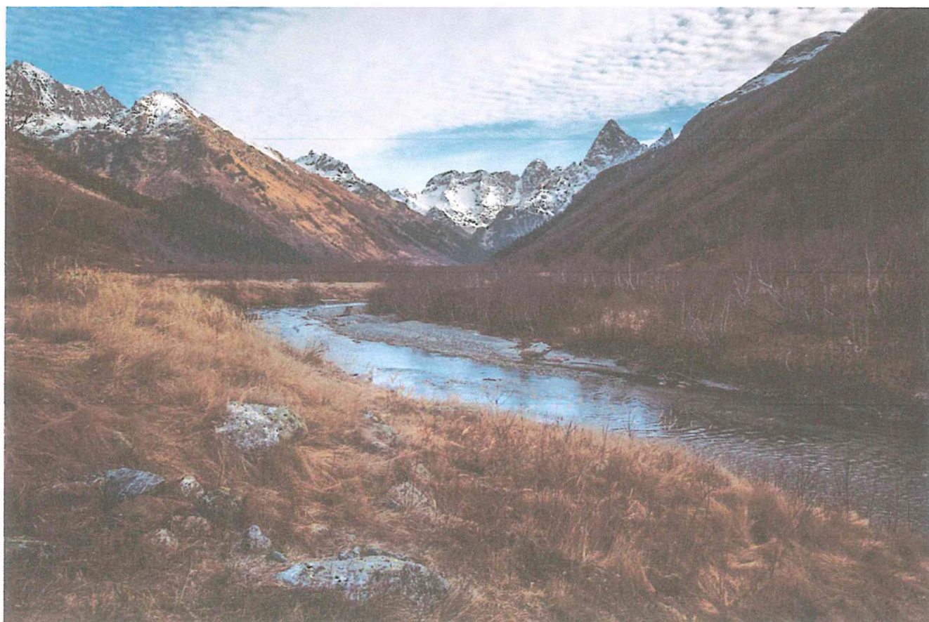
6 фото: Ущелье Гоначхир.