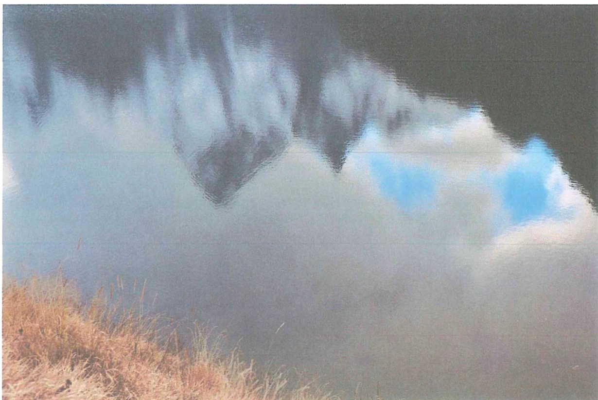
2 фото: Озеро Туманлы-Кель.