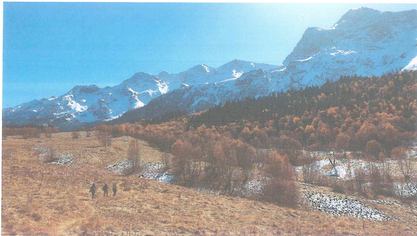
3 фото: Поход к Мусса-Ачитарским озерам.