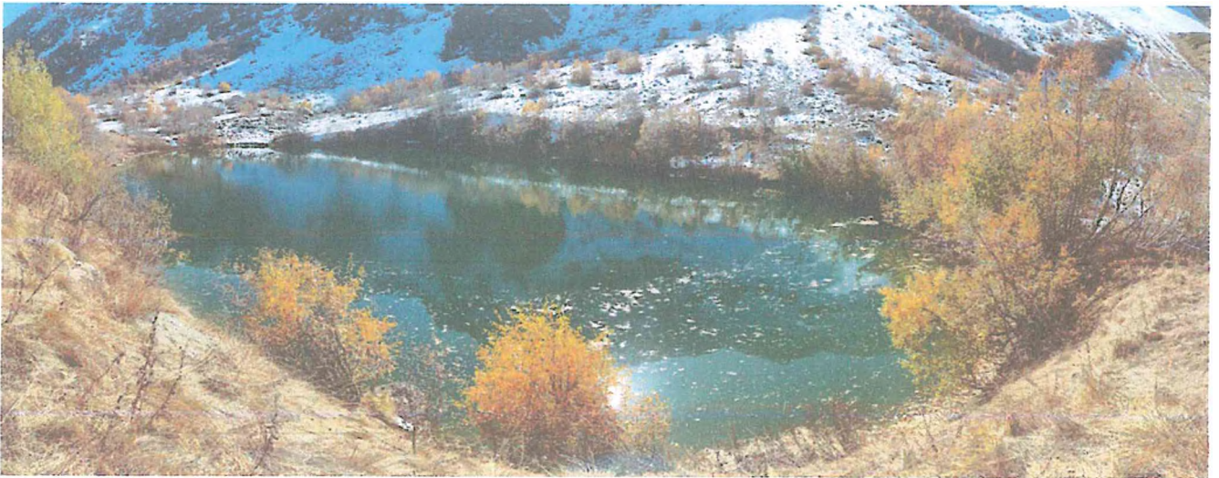
1 фото: Озеро Кёк-Кель.