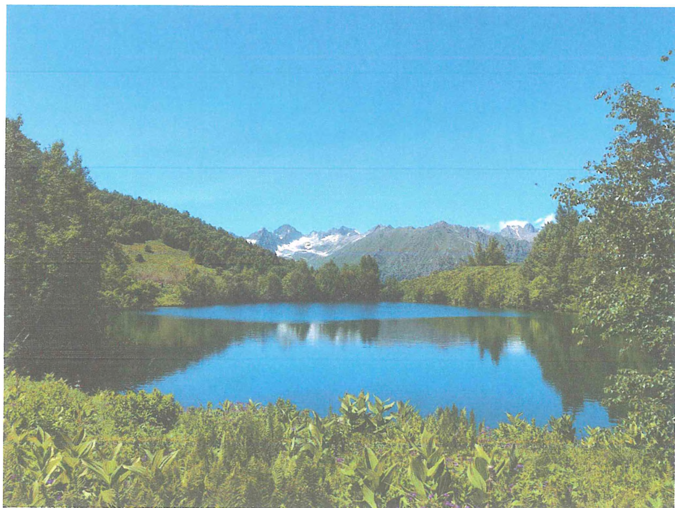
4 фото: Озеро Кёк-Кёль.