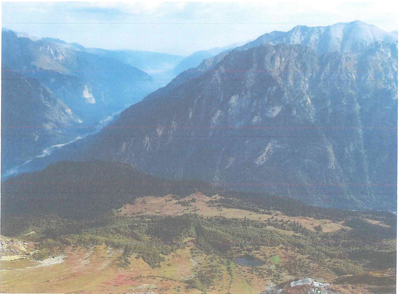
2 фото: Вид на озеро Кёк-Кель сверху.