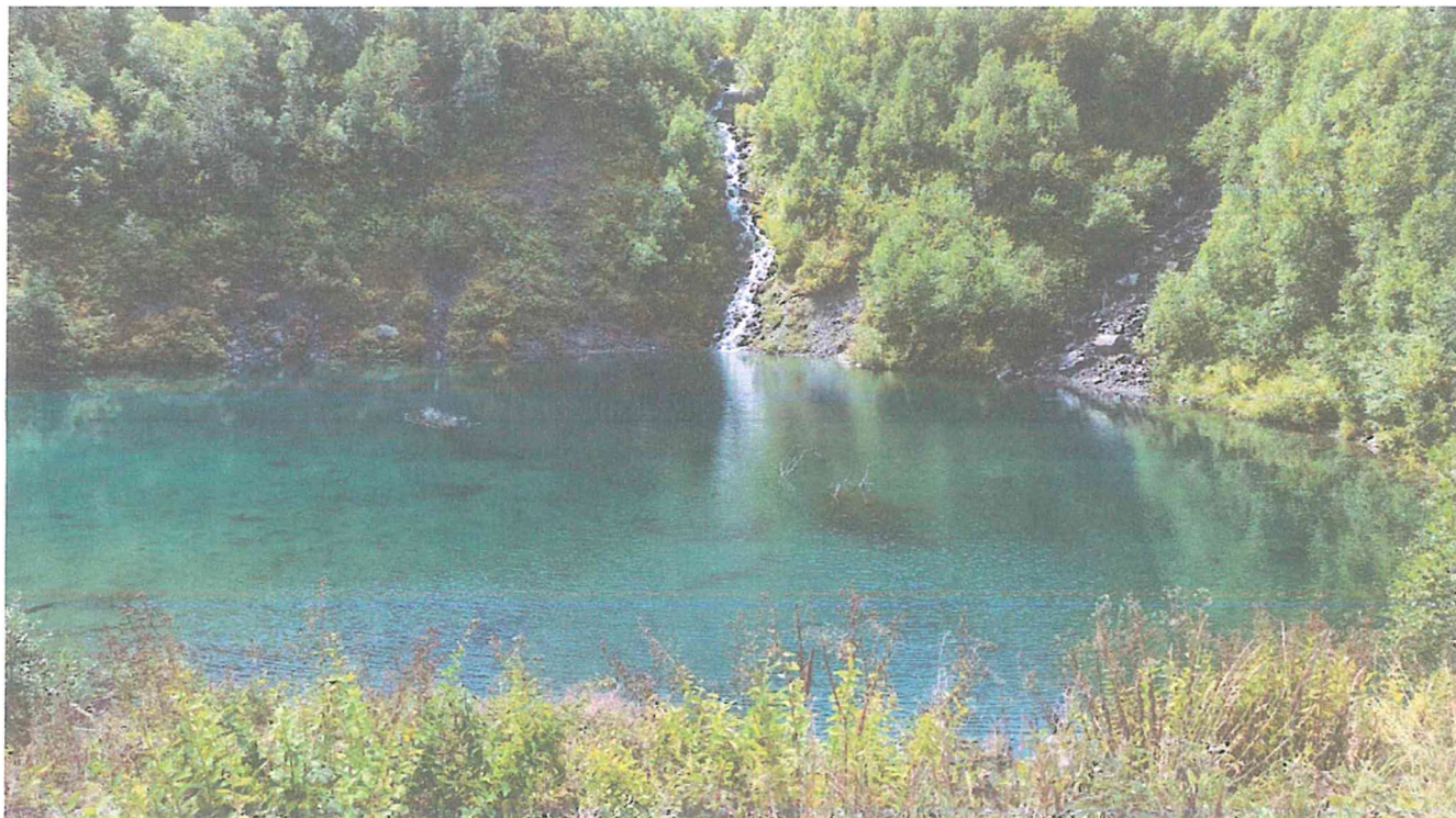
5 фото: Озеро Тамлык-Кель. Фотоархив Тебердинского национального парка