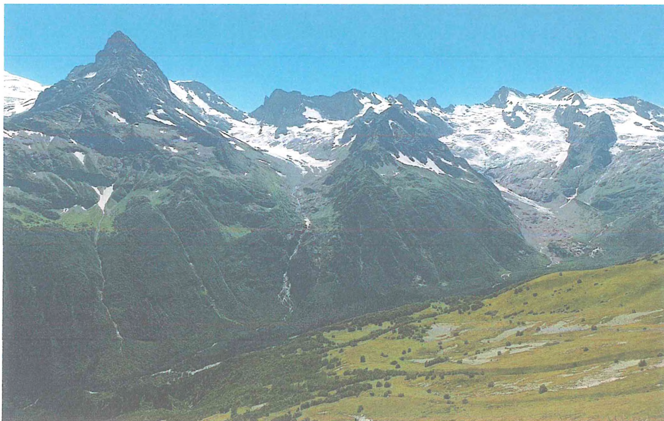
4 фото: Пик Кругозор Семенов-Баши