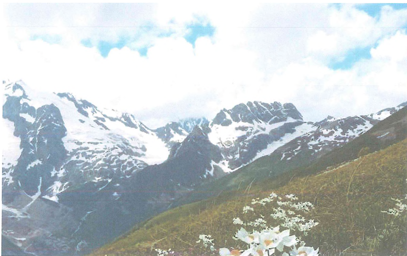
2 фото: Кругозор Семенов-Баши.