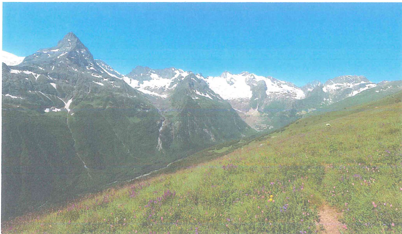
3 фото: Кругозора Семенов-Баши. Фотоархив Тебердинского национального парка.