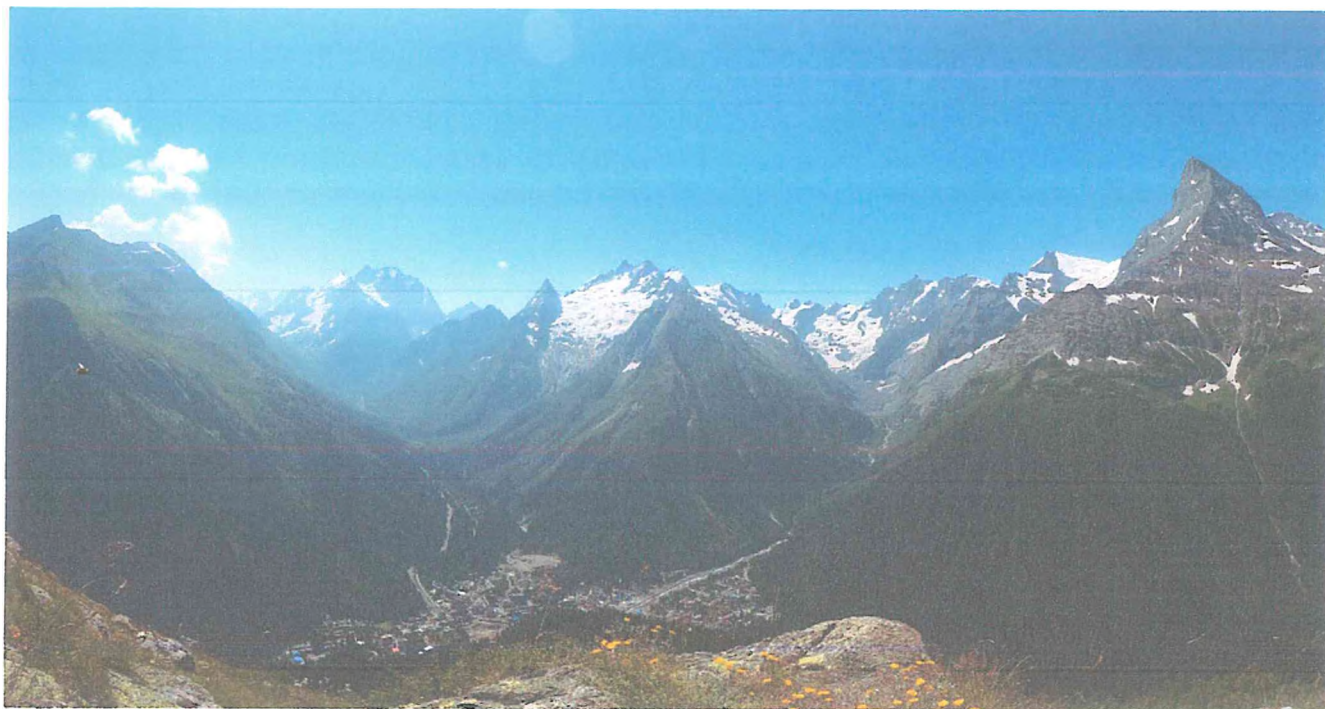
1 фото: Кругозор Семенов-Баши.