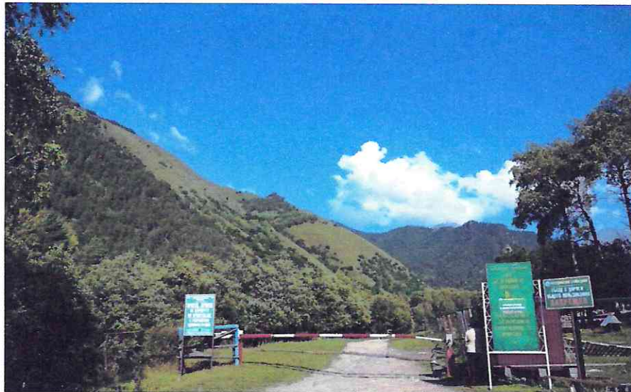
КПП «Джамагат» – место начала и окончания маршрута