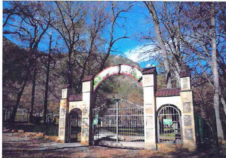
Вход в Демонстрационный вольерный комплекс